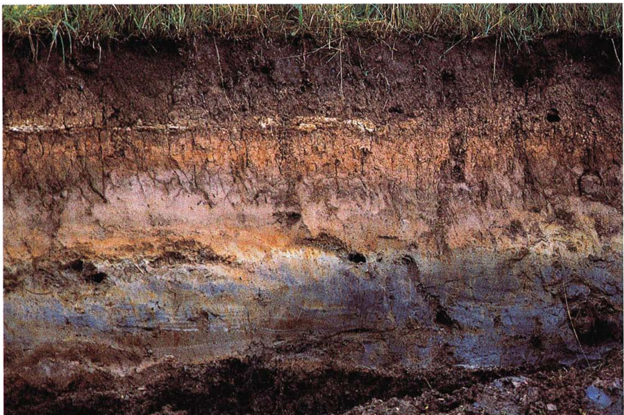
23 Mehrfach aufgehörter Gley aus Auenlehm mit verschwemmtem Laacher Bimstuff, weiß, späteiszeitlich (Leineaeue bei Northeim, Niedersachsen).