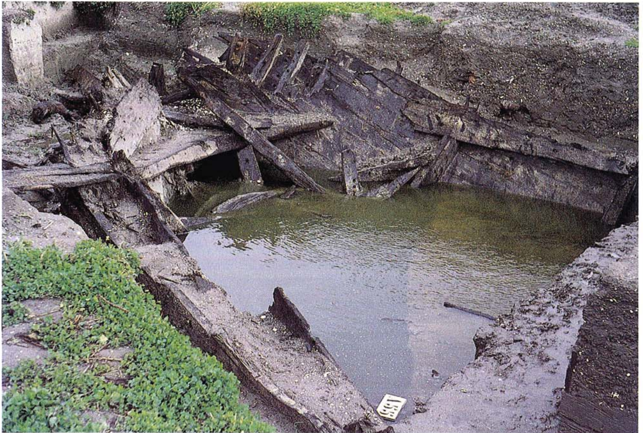
24 Junger Marschboden mit Schiffswrack aus dem 17. Jh., weiße Muschelschalen (Polder bei Lelystad, ehemalige Zuidersee, Niederlande).