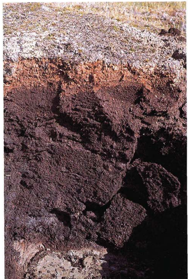
20 Profil im Moor mit Eishebung = Pals (Snjuttjotesjokk, Schwedisch Lappland).