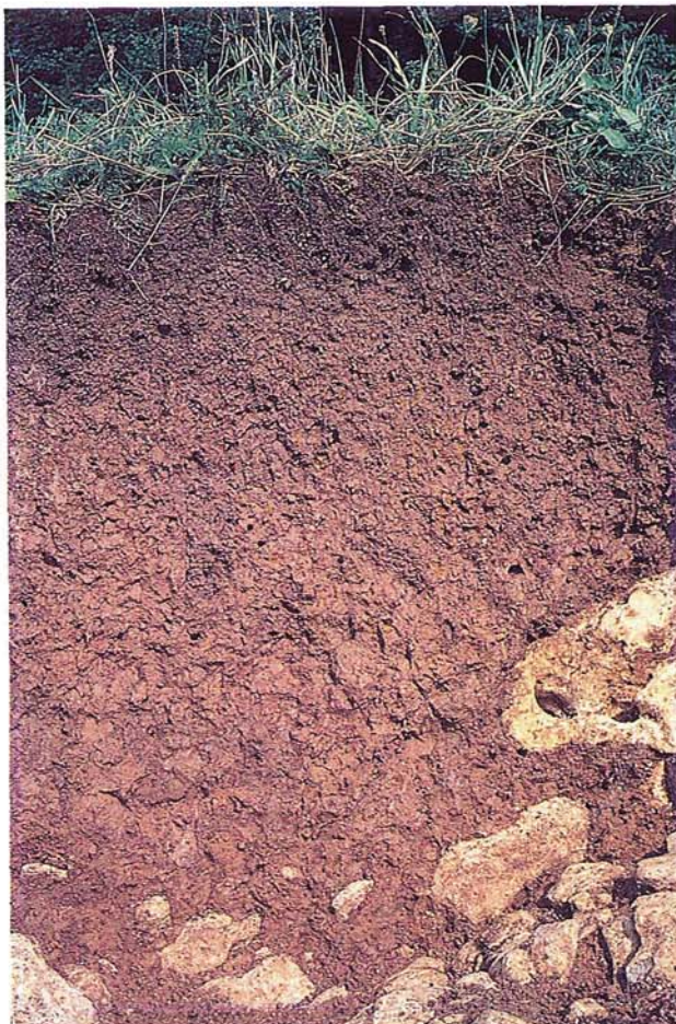
18 Terra fusca aus verkarstem Riffkalk (St. Johann, Württemberg).