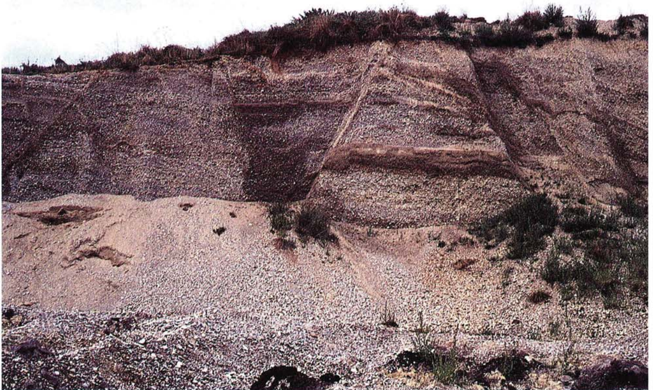
12 Terrassenschotter mit Verwerfungen von eiszeitlicher Gletscherüberfahrung (Höfen, Bayern).

Wichtigstes Kennzeichen aller Böden ist ihre Mächtigkeit (bei ungestörten Böden: zeitabhängige Entwicklungsstufe); ihre Gliederung folgt der Anordnung des Stoffbestandes im Raum. Allen Böden gemeinsam ist ein bestimmter Humusgehalt, der bei Ackerböden 2 bis 4 %, bei Wiesenböden 4 bis 8 %, bei Waldböden 8 bis 15 % im mineralischen Bereich betragen kann (Humusaufgaben >15 %, Torfe >30 % u. a.), aber breiten Schwankungen unterliegt (selbst in kurzzeitigem Abstand an einem Ort). Ebenso typisch ist ein (meist geringer) Gehalt an ocker-, braun- oder rotfärbenden Eisenoxiden in durchlüfteten und an (grün- oder blau-)graufärbenden Eisenverbindungen (-oxiden im ersten, -sulfiden im zweiten Fall) in sauerstoffarmen Bereichen. Breiten Schwankungen unterliegt der (aus dem Gestein freigesetzte oder durch Verwitterung neu gebildete) Tonanteil, während Schluff, Sand und Kies überwiegend gesteinsbürtig sind (Ausnahme: Kalkschluffe und -sande). Schluff und Sand bestehen meist aus Quarz mit (in dieser Reihenfolge abnehmenden Anteilen von) Feldspäten, Glimmern und Schwermineralen (Apatit, Zirkon, Turmalin, Rutil, Granat u. a.). Kalk kann in denselben Bodenhorizonten ein gesteinsbürtiges (primär-