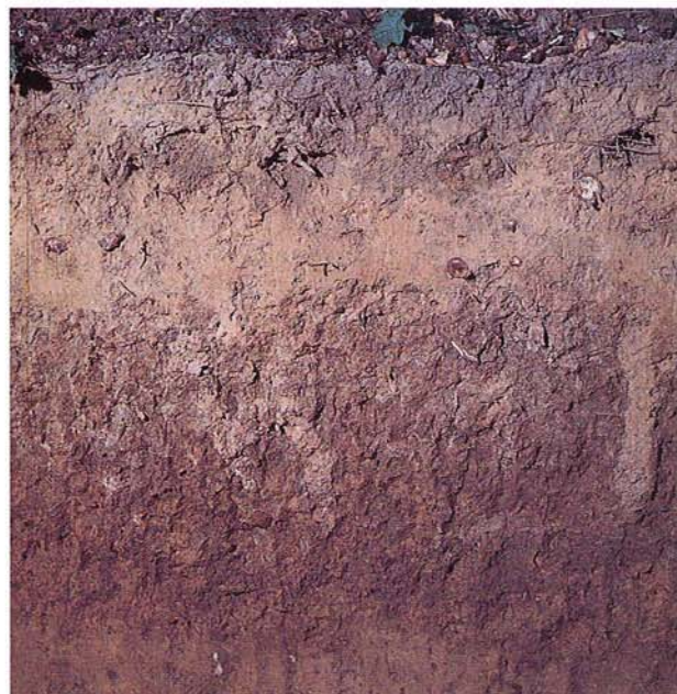
14 Parabraunerde aus Löss (Plieninger Wald, Württemberg).

Bei Flachmuldenrelief, tonigem Untergrund und/oder kühl-feuchterem Klima gehen die Parabraunerden der Löss- und Geschiebemergelgebiete in wechselfeuchte bis stark staunasse Pseudogleye über, aber auch bei Sackungsverdichtung im Periglazialklima, die zu einer plattigen Lamellierung des Unterbodens führt. Es beginnt mit Unterbodenmarmorierung, die mit ihrer grauweißen Bleichung (an Klüften, Wurm- und Wurzelröhren, aber auch um organische Strukturen, z. B. Pfostenlöcher) charakteristisch ist (Sd für Stauhhorizont mit hoher Lagerungsdichte). Mit zunehmender Staunässe wird der bräunliche Oberboden aufgehellt bis weißgrau (Sw für Stau wasserleiter); die Eisenoxide konzentrieren sich in Konkretionen (die sich auch um Eisengegenstände bilden) mit immer stärkerer Einengung auf den Grenzbereich Ober-/Unterboden.