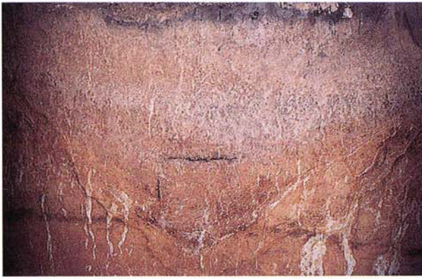
15 Pseudogley aus verschwemmtem Lösslehm mit Eisenoxidbändchen parallel zum Rand (bei Pfahlbach, Württemberg).

Zugleich verringert sich die Humuszersetzung und Einmischung, sodass Moder und schließlich Rohhumus entsteht. Da sich diese Entwicklung auch auf einzelnen jungsteinzeitlich besiedelten Hochflächen abzeichnet, könnte eine Klimaverschlechterung dafür verantwortlich sein.