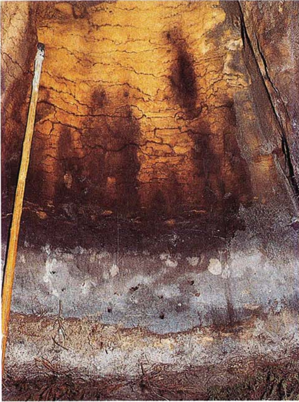
21 Podsol aus Dünenand mit teils wolkiger, teils bänderartiger Humusverlagerung (Ostniederlande).