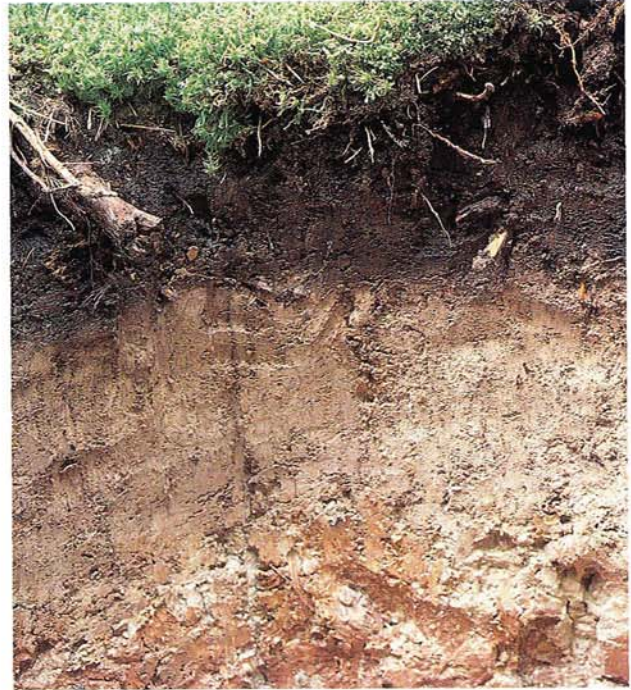
19 Stagnogley mit Torfmoos aus Buntsandsteinton (Klosterreichenbach, Schwarzwald).

Von den Unterwasserböden seien Gyttja (in sauerstoffreichen Gewässern reich an organischer Substanz), Sapropel (in sauerstoffarmen oder -freien Gewässern, reduzierend, schwärzlich) und DY (in sauerstoff- und nährstoffarmen Gewässern, sauer, dunkelbraun) erwähnt.