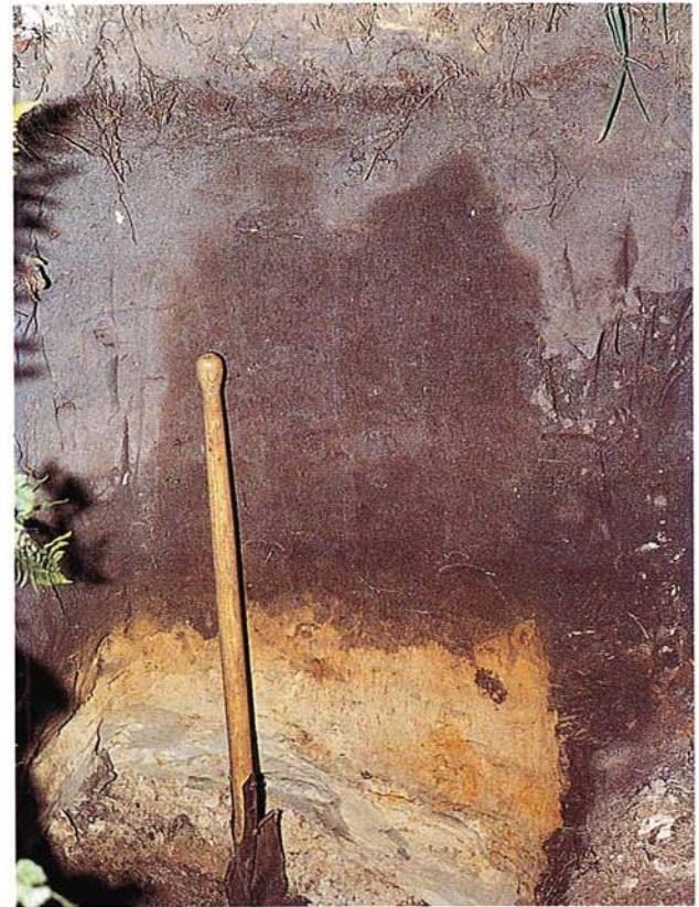
22 Übersichteter Plaggenschichtboden (Ostniederlande).