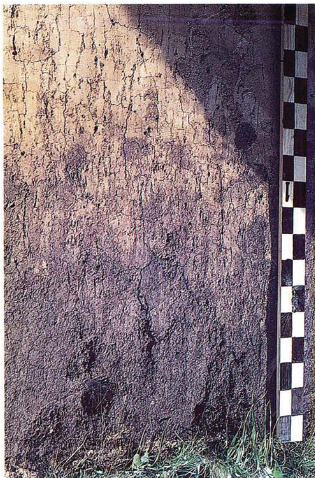
16 Schwarzerde aus Löss (Shortandy, russische Steppe).

Die Schwarzerden (Tschernoseme) aus Löss scheinen zumindest in den wärmer-trockeneren Landschaften Vorläufer der Parabraunerden gewesen zu sein; noch heute gibt es Übergangsformen zwischen beiden. Kennzeichnend