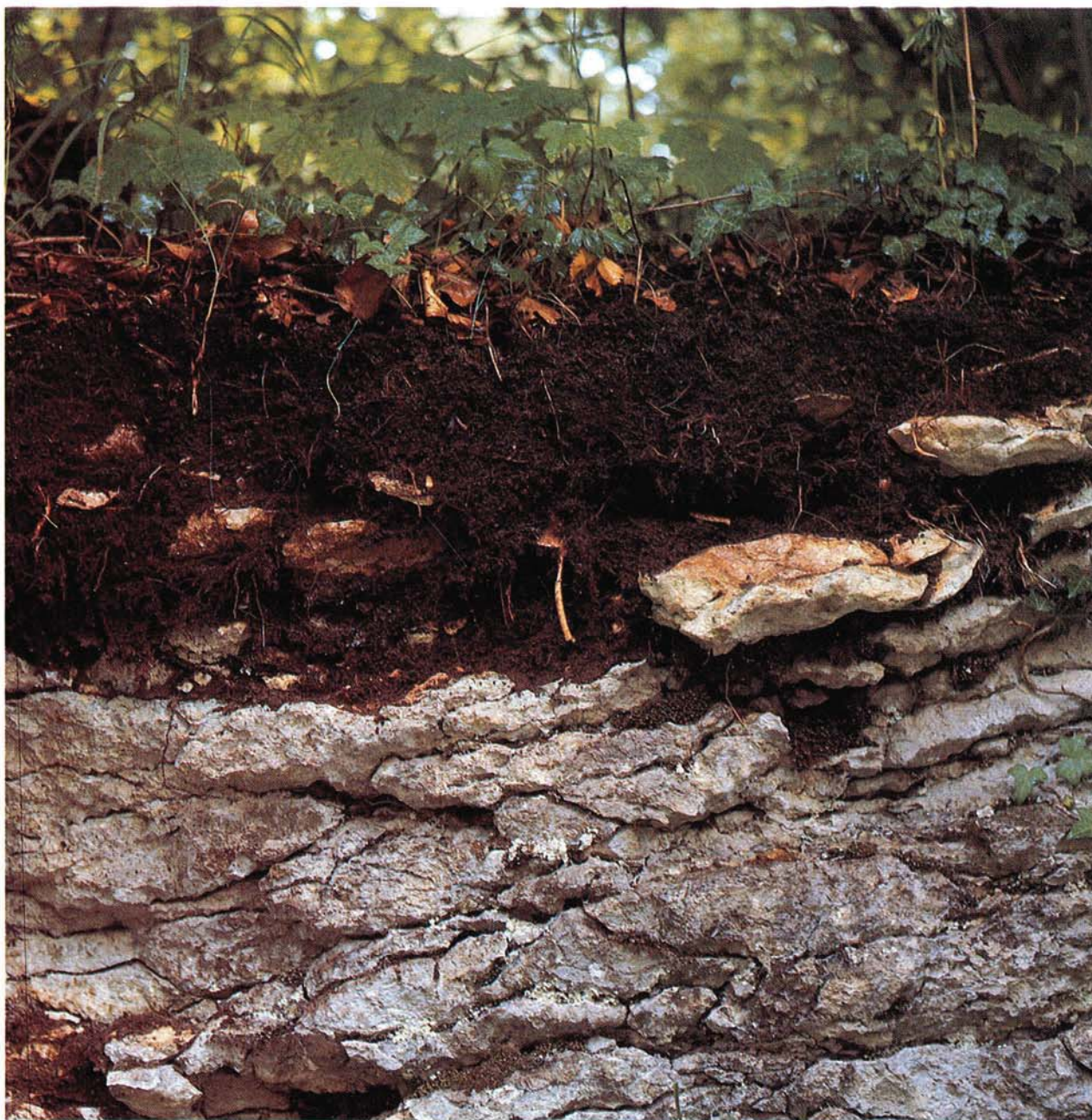
17 Rendzina aus Weißjura-Riffkalk (Sirchinger Steige, Württemberg).

grabenen Ah-Horizont begrenzt. Tieffumose Kolluvien sollten nicht mit Schwarzerden verwechselt werden, von denen sie sich durch ihre Lage im Relief wie auch durch erheblich geringere biologische Aktivität unterscheiden. Häufig sind Holzkohlen und Ziegelbröckchen; bisweilen treten deutliche Schichtgrenzen auf. Von den Grundwasserböden sind Vega (mit deutlichem Bv-Horizont) und Gley (mit der Abfolge Ah-Go-Gr) zu nennen. Verrostung im Grundwasserschwankungsbereich (Go) kann über die Goethitbildung und Braunfärbung hinaus zu Verkrustungen führen (in Eisengleyen), in die auch Eisengegenstände mit einbezogen werden. Der ständige Grundwasserbereich ist reduziert und daher grau (Gr), manchmal auch eisen- und kalkärmer. Da die Kohlensäure leichter aus